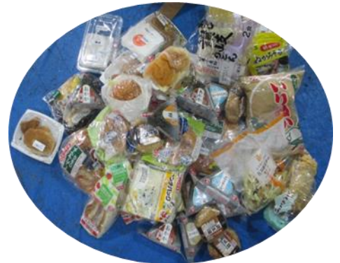
実際に賞味・消費期限切れなどにより、未開封で廃棄された食料品の一部