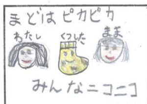
【ジュニアの部】最優秀賞