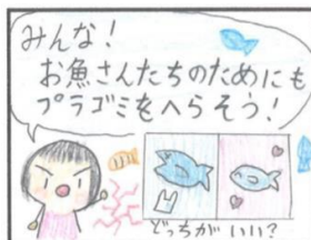
【ジュニアの部】最優秀賞