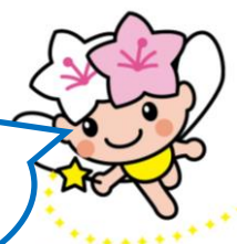
もったいない係長 ミヤリー

みやエコファミリー会員は 3ポイントもらえるよ！ たくさんのご応募 お待ちしております♪